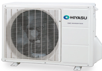
ASH 9 Ui-LU