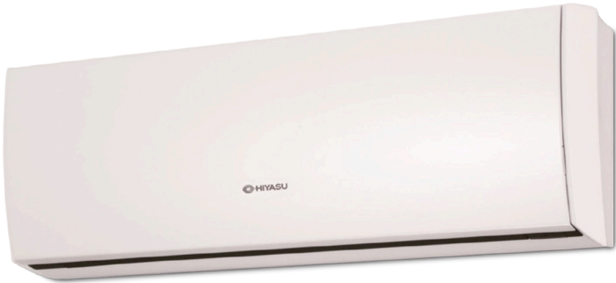
ASH 9-12 Ui - LU