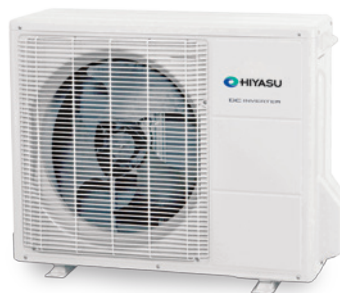
ASH 12 Ui-LU