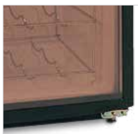
Porta reversível usando as mesmas dobradiças (ambos os modelos).