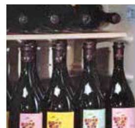
Interior em branco e vidro da porta fumado.