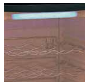
Iluminação interior superior e horizontal.