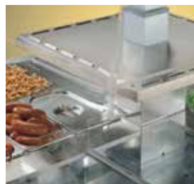
Modelo BM mantém o calor com o sistema de banho-maria.