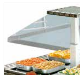
Tela de metacrilato com elevação automática.