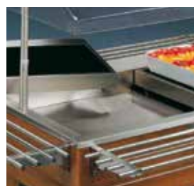
Modelo Hot com placas de vitrocerâmica.