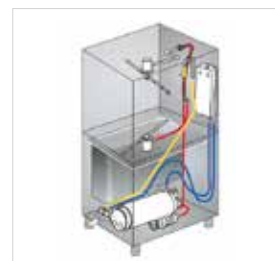
Inovador sistema de enxaguamento "Thermorinse" que garante uma temperatura e uma pressão constantes.