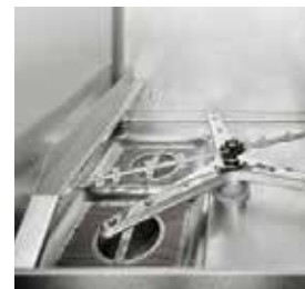
Filtro integral do depósito em aço inoxidável AISI 304, o que facilita a limpeza da água.