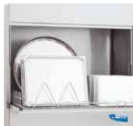
Permite a lavagem de bandejas para pastelaria com 40x60 cm. (Opcional)