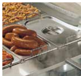
Os modelos Bain Marie mantêm o calor com o sistema de banho-maria.