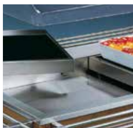
Modelo Hot com placas vitrocerâmicas.