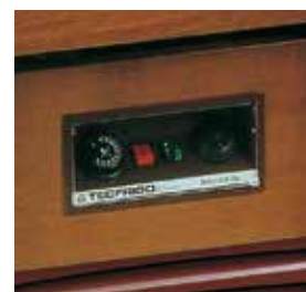
Painéis de controlo com termóstato e termómetro digital.