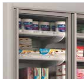
Portas em vidro duplo.