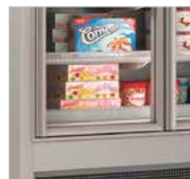
Vitrine mural ideal para a conservação a baixas temperaturas.