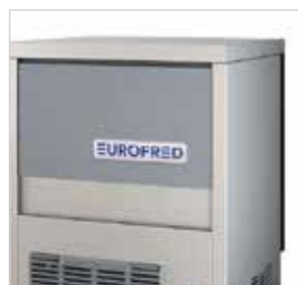
Construídos em aço inoxidável AISI304 que garante uma grande durabilidade da máquina.