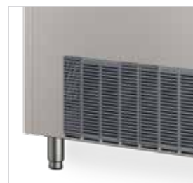
Pés reguláveis em altura a partir do modelo CP-CG 37.