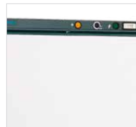
Painel de controlo com: - piloto de ativação - interruptor congelação rápida - termóstato - termómetro