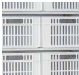
Modelos negativos: cestas de origem para uma melhor distribuição do produto armazenado.