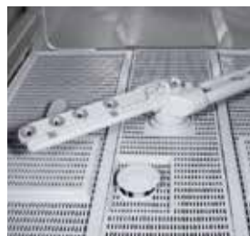
Braços de lavagem inferiores de última geração.