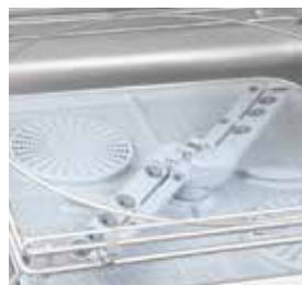
Braços de lavagem rotativos.