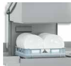
Nova geração de máquinas de lavar pratos de campânula com cesta de 50x50, fabricada com parede simples.