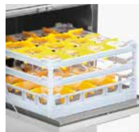
Modelo FAST 160 e OCEAN 360 cestas de 50x50 cm.