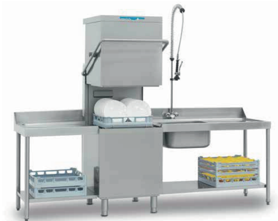
OCEAN 380 (Mesas opcionais)