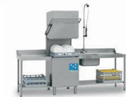
FAST 180 (Mesas opcionais)