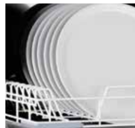
Modelo FAST 160. Altura útil de lavagem de 365 mm.