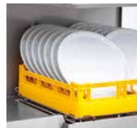
Pratos 400 mm de altura.