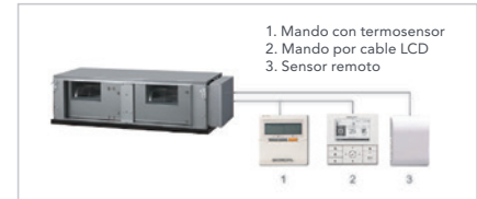
Mando remoto con termosensor

Diseño tecnológicamente estudiado para producir una presión disponible de 250 Pa.