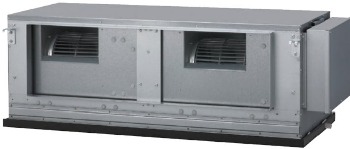
ACU 250 Uit-LH