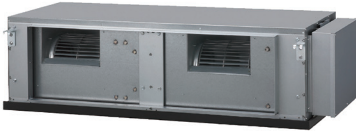
ACU 200 Uiat-LH