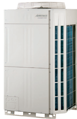
ACU 200-250 Uiat-LH