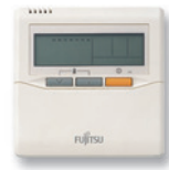
Mando remoto con termosensor