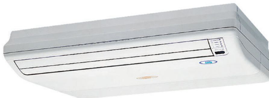
ABGA 12-24 G