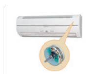
Motor High Power DC.