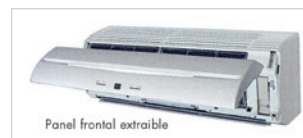
Panel frontal extraíble

Reservados los derechos a modificar modelos y datos técnicos.