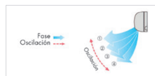
Rejilla de ventilación de oscilación automática.