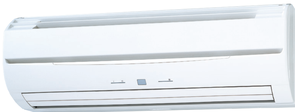
ASGE 4-14 G / ASGA 4-14G