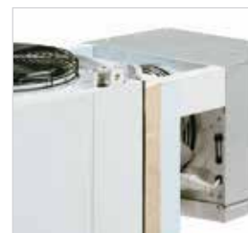
Tampão opcional para facilitar ainda mais a montagem do equipamento.