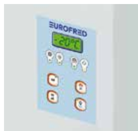
Controlo eletrónico para a regulação dos diferentes parâmetros de funcionamento.