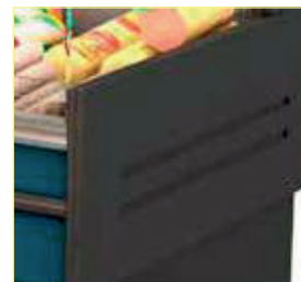
Laterais ABS 40 mm.