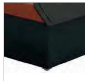
Modelo FAST 160. Altura útil de lavagem de 365mm.