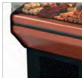
Proteção contra impactos.