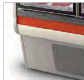
Proteção contra impactos de série.