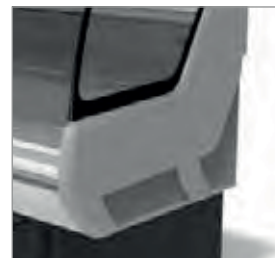
Laterais ABS 40 mm