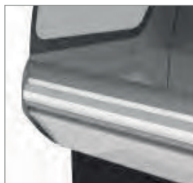
Proteção contra impactos de série