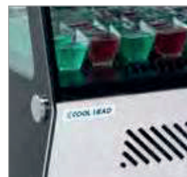
Painel inferior em aço inoxidável