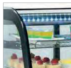
Elevada luminosidade LED