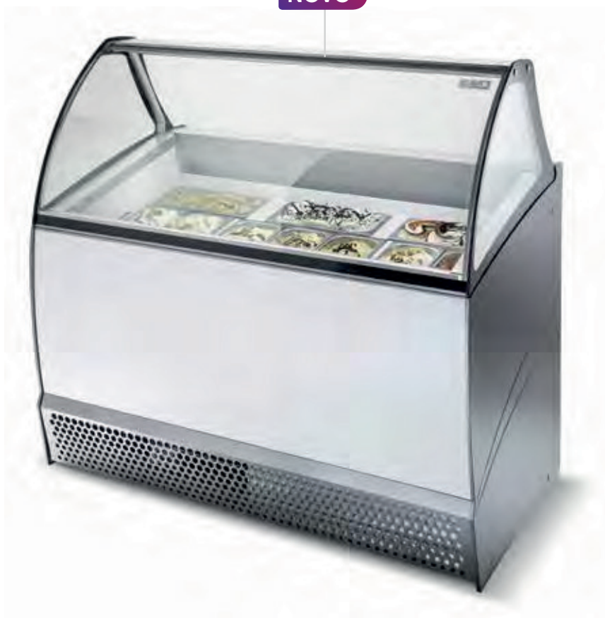
NEW BERMUDA 10