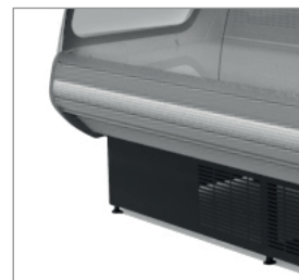
Proteção contra impactos de série.