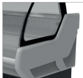
Laterais ABS 40 mm.