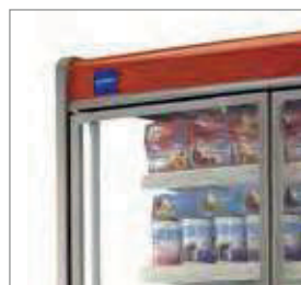
Luz LED T5 de série.