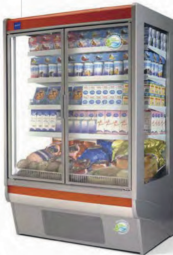
SAPPHIRE 1250 3M2 Parte frontal vermelha opcional