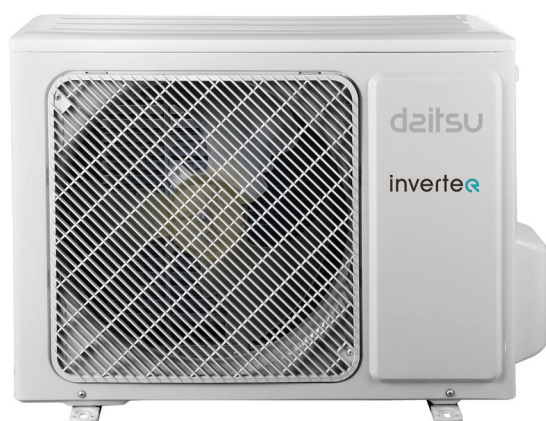
DOSM 18 Ui-DN

Largura 790 mm Altura 275 mm Profundidade 200 mm